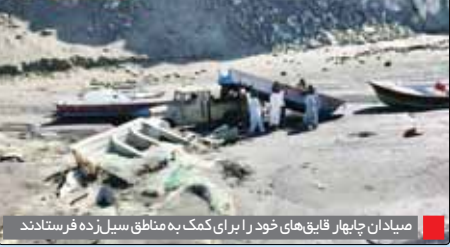
میدان چهار قلیق‌های خود را برای کمک به مناطق سیل‌زده فرستادند