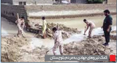
کمک‌نیروهای جهادی به مردم بلوچستان