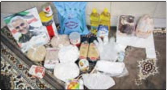
جوانان و بسیجیان مسجد جامع باغ فیض تهران در رزمایش حمل‌ونقل کمک‌مستانه با تهیه و توزیع ۱۳۰ بسته بهداشتی در مناطق ۵ و ۲۲ واحده تهران در سومین مرحله در این پویش شرکت کردند.