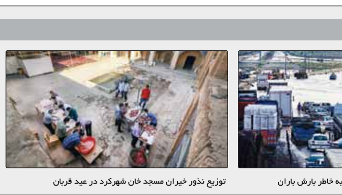
توزیع نذور خیران مسجد خان شکرک در عید قربان