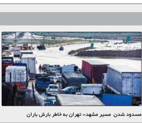
مسدود شدن مسیر مشهد- تهران به خاطر بارش باران