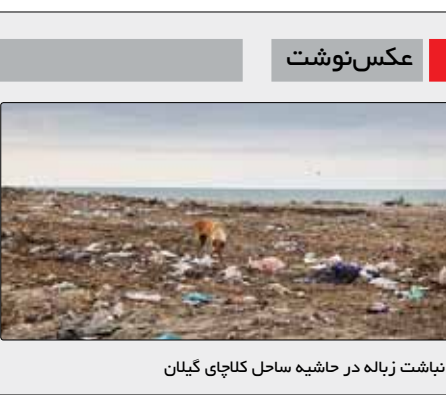
انباشت زباله در حاشیه ساحل کلکچای گیلان