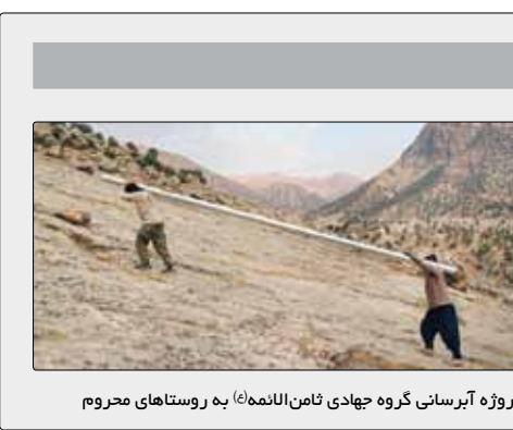
پروژه آبرسانی گروه جهادی ثامن‌اللهم(ع) به روستاهای محروم