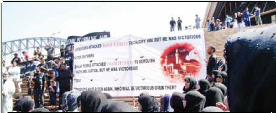
عزاداری شیعیان استرالیایی در روز عاشورا مقابل ابراهامس، بنای نمادین شهر سیدنی: متن پارچه نوشته سفید، مسیح (ع) و حسین (ع) را پیروز مبارزه با ظالمان زمانه توصیف می‌کند