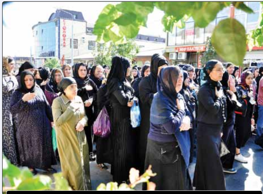
دسته عزاداری عاشورا در شهر دربند در جمهوری داغستان روسیه

همه‌گیری کرونا و قرنطینه سفت و سخت چند ماهه اخیر مانع از آن نشد که در گوشه و کنار اروپا، مجالس سوگواری حسینی با رعایت پروتکل‌های بهداشتی برپا نشود. تشکیل هیأت متعدد در بریتانیا، نوحه‌خوانی شب عاشورا به زبان دانمارکی در مسجد امام علی (ع) کپنهاگ، برگزاری مجالس عزای مرکز اسلامی اهل بیت (ع) در زوریخ سوییس و ورشو لهستان، برگزاری مراسم تاسوعا در فضای باز مرکز اسلامی برلین و برپایی ایستگاه عاشورا در شهر استاونگر نروژ در رسانه‌ها بازتاب داشته است.