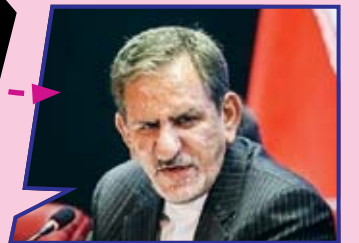
معاون اول رئیس‌جمهور