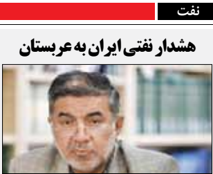
هشدار نفتی ایران به عربستان