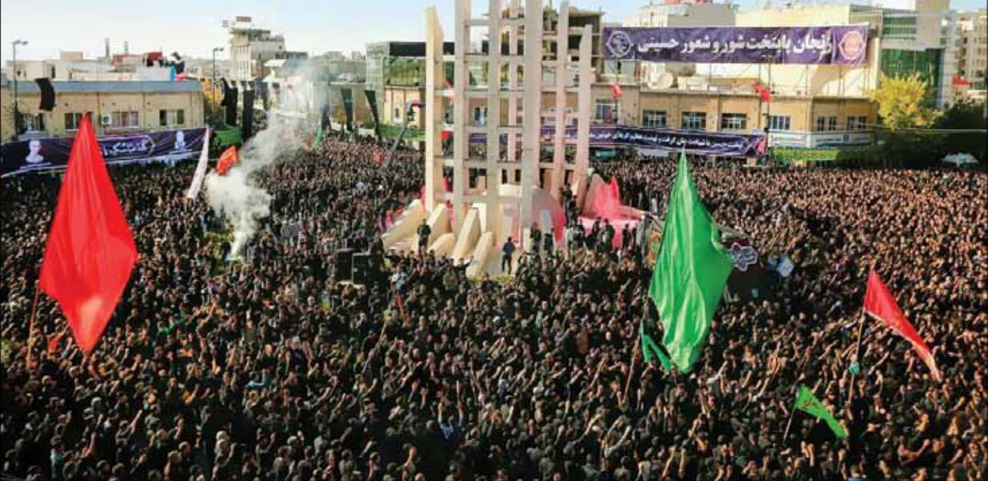
ایران با شهادت شور و شعور حسینی