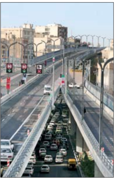
تصویر از مراسم بهره‌برداری

دستگیری دختر تبر به دست در پایتخت دختر جوانی که با ۲ همدست پسر خود از هموطنان جنوب تهران با تبر وقمه زورگیری می‌کرد توسط پلیس و با شلیک ۱۷ تیر جنگی دستگیر شد. باشگاه خبرنگاران در این باره نوشت: ماموران کلاترزی ۱۵۲ خلی ابادنو روز جمعه در حال گشت‌زدن در سطح منطقه بودند که ناگهان متوجه یک دستگاه خودروی تیووتا شدند که یک دختر جوان و ۲ پسر دیگر که همگی از سابقه‌داران زورگیری و سرقت بوده که در حال حاضر تحت تعقیب هستند. به دلیل همین موضوع ماموران جلوتر رفتند و در مقابل خودروی تیووتا ایستاده و دستور ایست دادند ولی زن راننده به ماموران توجهی نکرد و بر سرعت خود افزود تا عوامل انتظامی را زیر بگیرد. در ادامه ماموران خودرو را محاصره کردند ولی افراد شرور با در دست داشتن تبر و قمه قصد حمله به سمت ماموران را داشتند که با شلیک ۶ تیر جنگی خلع سلاح شده و زمینگیر شدند.