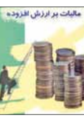
مالیات بر ارزش افزوده

سازمان امور مالیاتی کشور از آغاز مهلت ارائه اظهارنامه مالیات بر ارزش افزوده تابستان ۹۳ در دیروز ۱۵ مهرماه خبر داد. سازمان امور مالیاتی کشور اعلام کرد: با توجه به اینکه آخرین مهلت ارائه اظهارنامه مالیات بر ارزش افزوده دوره دوم (فصل تابستان) سال ۱۳۹۳ از اول السی ۱۵ مهرماه است، مودیانی می‌توانند از طریق سایت عملیات الکترونیک مالیات بر ارزش افزوده به آدرس WWW.EVAT.IR نسبت به ارائه اظهارنامه و پرداخت مالیات اقدام کنند. بنابراین به همه مودیانی موکول کنند.