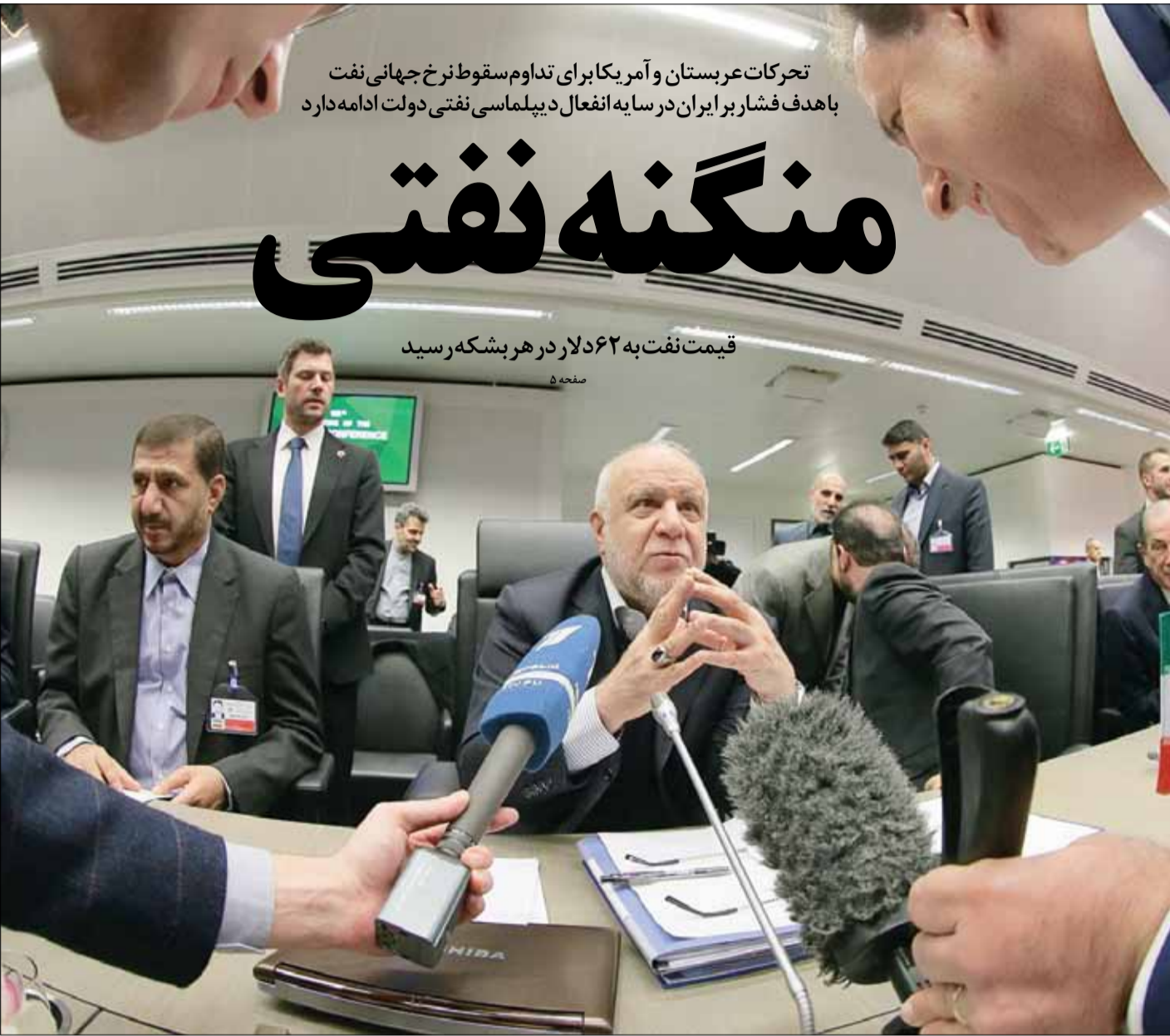
قیمت نفت به ۵۶۲ دلار در هر بشکه رسید