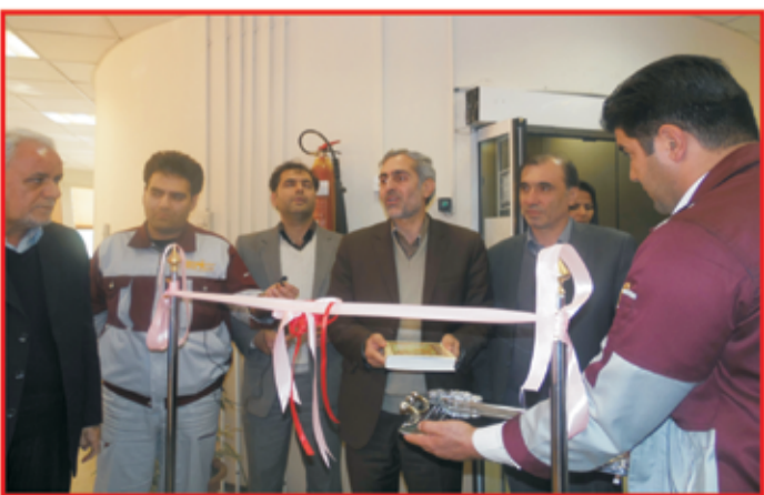
گراوندی بیان داشت: فیلترهای استفاده شده در این شرکت برای خروجی غبار زیر ۱۵ میلی‌گرم است که این امر تنها با انتخاب تجهیزات مدرن و به روز دنیا مسیر شده است.

در ادامه این نشست، فرماندار شهرستان کرمانشاه اظهار داشت: در آغاز هزار سوم در کشورهای دنیا انقلاب زیست محیطی روی داد و این امر در کشورهای توسعه یافته و اروپایی نمود بیشتری داشت و بالعکس در کشورهای در حال توسعه و یا توسعه نیافته رنگ و نمود کمتری دارد. فضل‌الله رنجبر تأکید کرد: امروز باید نگاه ویژه‌ای به محیط زیست داشته باشیم و اگر نگاهمان در این امر جامع و کامل نباشد بی‌شک در امر توسعه شکست خواهیم خورد. فرماندار شهرستان کرمانشاه گفت: در دین مبین اسلام و هم در قسواتین جمهوری