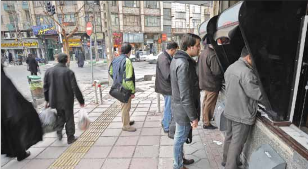
تهران، وطن امروز