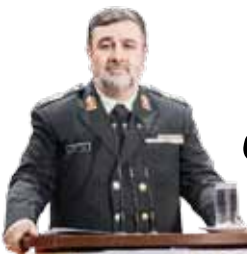
فرمانده نیروی انتظامی