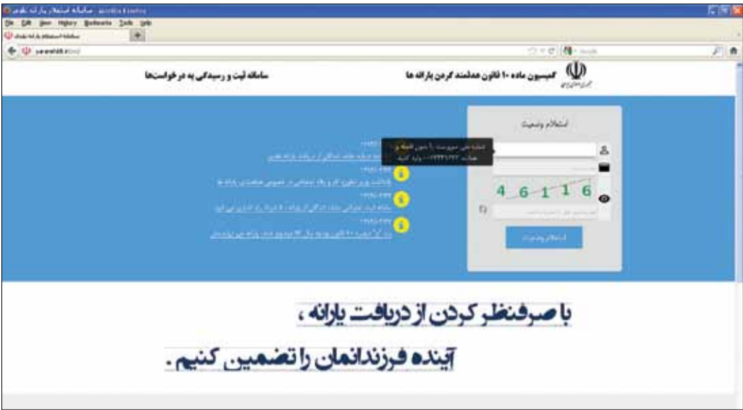
صفحه اول سایت اعتراض به حذف یارانه نقدی

«دارد»، «ن دارد» قرار گرفته است. در این مرحله اگر