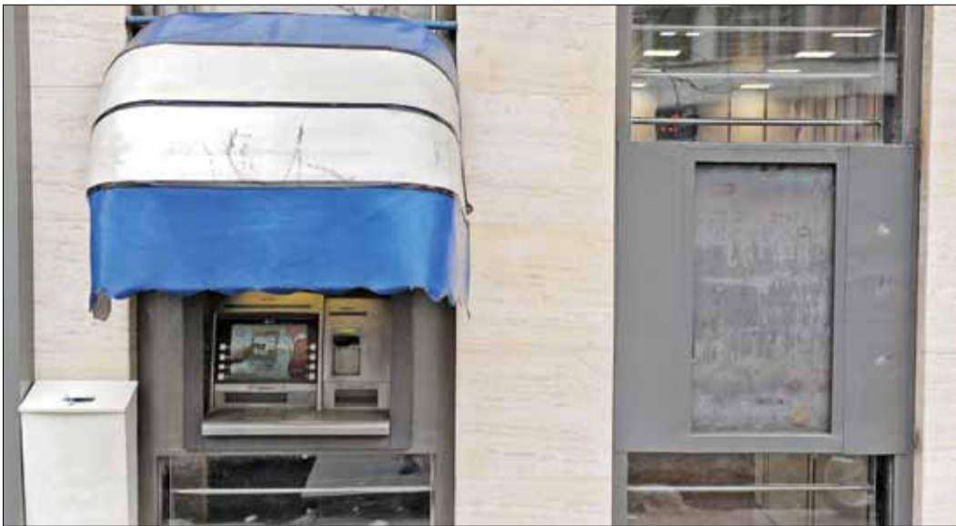
تکس، وطن امروز