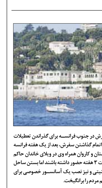
قاب جهان فرانسوی‌ها سلمان را فراری دادند

گروه بین‌الملل: مدیرکل وزارت خارجه رژیم‌صهیونیستی طی رسمی‌ترین اظهار نظر از سوی تل‌آویو، عربستان‌سعودی را همپیمان رژیم در منطقه دانست. «دوری گولد» (نفر سمت راست‌عکس) همان کسی است که چندی پیش تصویر دست‌دانش با انور عشقی یکی از ژنرال‌های سابق و مشاوران عالی‌رتبه نهاد پادشاهی دربار سعودی در کنفرانسی آمریکا درباره پرونده هسته‌ای ایران جنجال آفرید. حال به گزارش سایت اسرائیلی معا، یو او در اظهاراتی جدید گفته است: «کشور پادشاهی عربستان سعودی همپیمان اسرائیل است.» این اظهار نظر