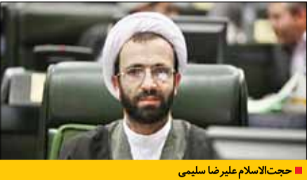
■ حجت‌الاسلام علیرضا سلیمی