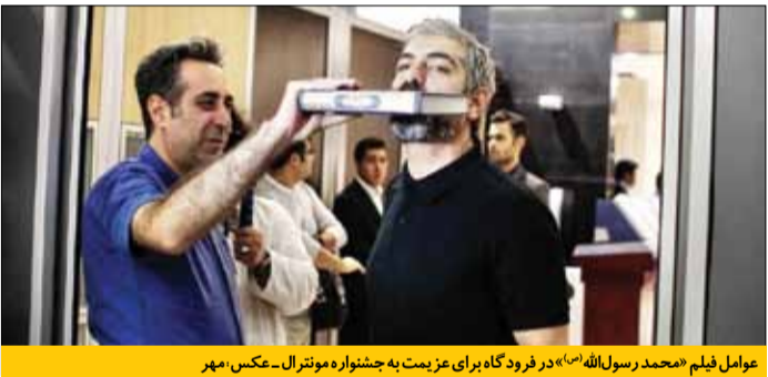
عوامل فیلم «محمد رسول الله(ص)» در فرودگاه برای عزیمت به جشنواره مونترال

امسال فیلم «محمد رسول الله(ص)» ساخته مجید مجیدی با تحسین قابل توجه رئیس این جشنواره به عنوان اولین فیلم سی‌ونهمین دوره جشنواره انتخاب