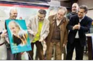
عکس: ایراسهم جندی وطن امروز