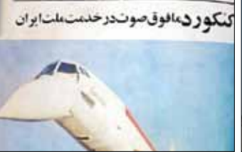
کنکور دایق صوت در خدمت ملت ایران

در این معامله قرار است ۱۵ درصد از کل رقم قرارداد را ایران تأمین کند، ۲۰ درصد را شرکت ایرباس از منابع خود پوشش دهد و مابقی توسط صندوق توسعه حمایت از صادرات اروپا تأمین شود. اگر چه براساس این مدل مالی، ۸۵ درصد مبلغ این هواپیماها توسط فروشنده تأمین می‌شود و این هواپیماها به صورت اجاره در اختیار ایران قرار می‌گیرد اما توجه کنید که فرانسه منافع کل اتحادیه اروپایی را به منافع شرکت ایرباس گره زده است و برای وصول ۸۵ درصد باقیمانده، شرکای بین‌المللی بسیاری را درگیر کرده است. برای روشن نگه داشتن بسیار مهم سناریو دوم، توجه کنید که هواپیما یک سرمایه متحرک است و اصلاً نباید تصور شود به اعتبار اینکه اجاره به شرط تملیک شده و در اختیار ایران قرار گرفته است، پس امنیت اقتصاد ایران تأمین خواهد شد. نباید تصور کنیم که طی این قرارداد اموال آنها در اختیار ما قرار می‌گیرد و آنها باید نگران باشند!