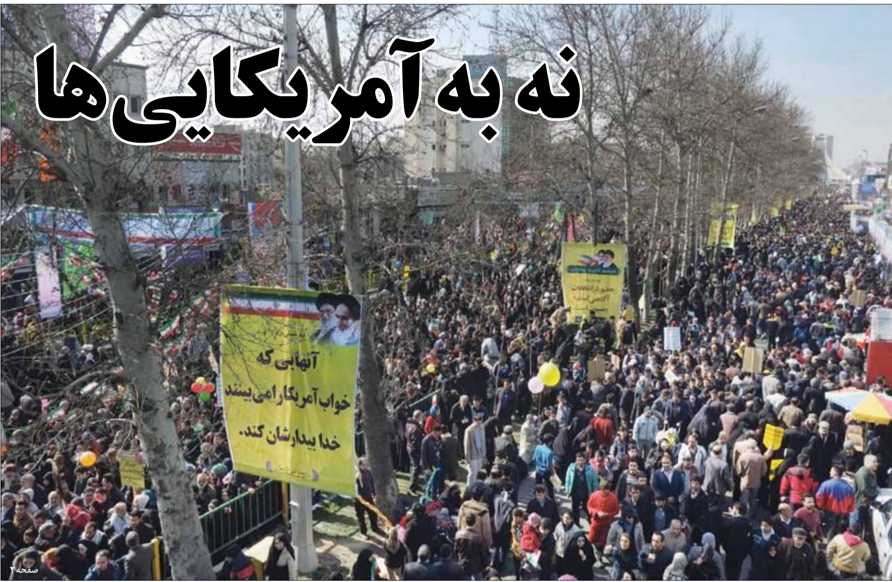
میلیون‌ها ایرانی در ۱۰۰۰ شهر و ۵۰۰۰ روستا در هشتمین سالگرد انقلاب اسلامی بر پیمان ضد استکباری خود ایستادند و رهبری تأکید کردند

آن قابل اعتنا شود. کلید اصلی این استراتژی زمانی در دست ایران خواهد افتاد که فرانسه در کوتاه‌مدت سرمایه‌های قابل توجهی را به ایران منتقل کند یا به خاطر گره خوردن مناقش با امنیت ایران، در این باره مجبور به حمایت از ثبات برجام و استمرار لغو تحریم‌ها باشد. این سناریو که محتمل‌ترین نوع آن است از قضا نقدها و اشکالات جدی تری هم دارد؛ اول اینکه ما در گذشته نیز با گره زدن منافع شرکت عظیم توتال به منافع خود سعی در کشاندن فرانسه به این بازی داشته‌ایم اما به دلیل اینکه ابزارهای حقوقی لازم در فضای بین‌الملل معمولاً کارکرد لازم را برای ما نداشتند و مناقشات با ابزارهای سیاسی مدیریت شده‌اند، ما بازنده میدان بودیم. مبلغ قرارداد ایرباس ۱۰/۵ میلیارد دلار است و دوره تحویل این هواپیماها از ماه آینده به مدت ۸ سال خواهد بود. این زمان تحویل نشان می‌دهد برخلاف تصور اخیر مبنی بر بین‌گذاری برجام به نفع ما، این ایران است که با ابزار ایرباس محدود شده تا به برجام پایبند بماند. همانطور که اعلام شده است دوره تحویل این هواپیماها برابر با دوره تعلیق تحریم است. بنابراین ما تا آخرین روز تعهدات در برجام به دلیل قرارداد هواپیماها مجبوریم نقش پسر خوب را ایفا کنیم تا دریافت هواپیماها به تعویق درنیاید! داستان زمانی برعکس می‌شد که ما هواپیماها را حداکثر طی ۳ سال تحویل می‌گرفتیم و فرانسه به جهت نگرانی برای دریافت پول آنها به صیانت‌کننده برجام تبدیل می‌شد. اکنون زمان تحویل هواپیماها با طول مدت تعهدات ما برابر است. پس این قرارداد می‌تواند یک گروکشی اقتصادی برجام علیه ناوگان هوایی ایران و به نفع اروپا باشد.