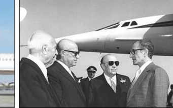
کنکور دایق صوت در خدمت ملت ایران