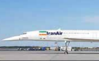
کنکور دایق صوت در خدمت ملت ایران