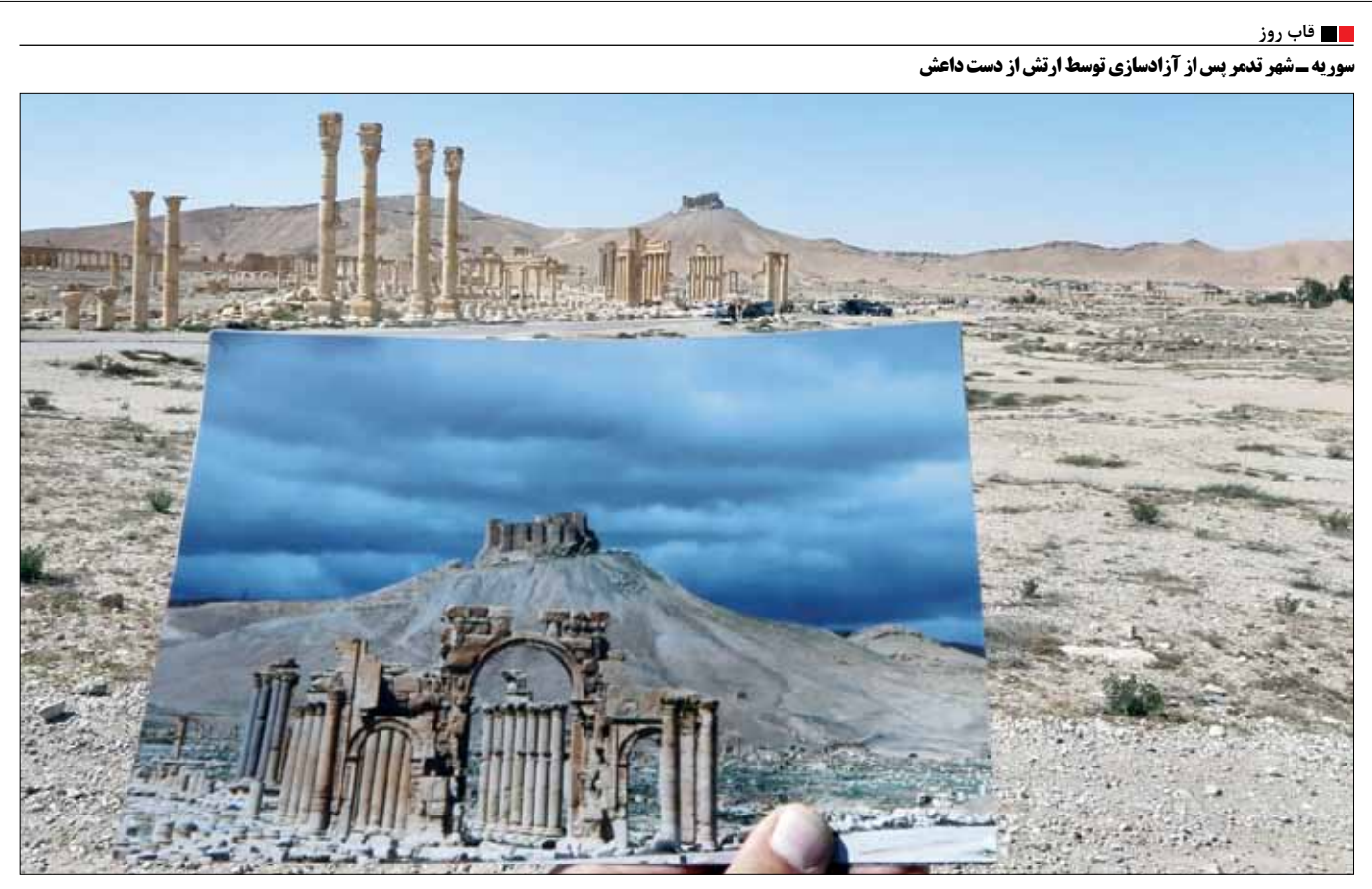
سوره — شهر دهم پس از آزادسازی توسط ارتش از دست داعش