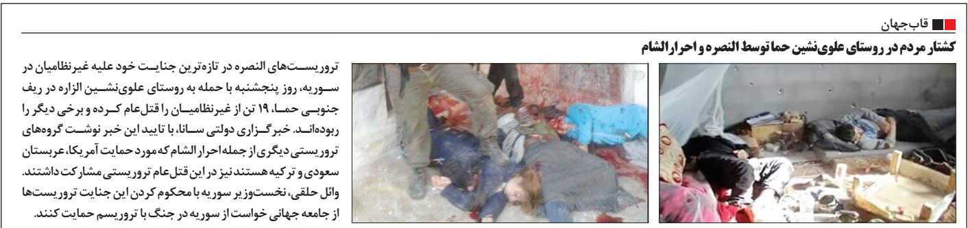
کاب‌جهان کشتار مردم در روستای علوی‌نشین حما توسط النصره و احرار الشام

حمایت آمریکا، فرانسه، انگلیس و اوکراین از جنایتکاران «احرار الشام» و «جیش‌الاسلام» عفو بین‌الملل: عرب‌ها و ترکیه به تروریست‌ها سلاح ندهند گروه بین‌الملل: عفو بین‌الملل دیروز با صدور بیانی‌های نهنتها گروه‌های تروریستی در استان حلب سوریه را به‌خاطر حملات بی‌هدف و استفاده از سلاح‌های شیمیایی مرتکب جنایات جنگی دانست بلکه رسماً شیخ‌نشین‌ها و ترکیه را به حمایت تسلیحاتی از آنها متهم کرد. براساس بیانی‌های این نهاد حقوق‌بشری، مدارک به‌دست آمده حاکی از آن است که ده‌ها نفر از غیرنظامیان در منطقه شیخ‌مقصود در نزدیکی شهر حلب بر اثر گلوله‌باران‌های بدون هدف تروریست‌ها کشته شده‌اند و همچنین احتمال انجام حمله‌های شیمیایی توسط آنها مطرح شده که «مادگدانا مغربی» قائم‌مقام مدیر بخش خاورمیانه عفو بین‌الملل آنها را جنایت جنگی خوانده است. عفو بین‌الملل در عین حال از مقامات کشورهای عربی حوزه خلیج‌فارس و