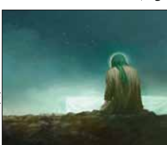
مردود چندی، سال ۹۲

■ در این کشور فرهنگ را افراد پیش می‌برند. مدیریت دولتی وجود ندارد. در واقع مدیریت جز اینکه چوب لای چرخ هنرمند بگذارد کاری نمی‌کند. افراد هستند که تک‌تک و انفرادی، هر کدام در گوشه‌های دارند بار کل فرهنگ را به دوش می‌کشند، یکی در گوشه یک گالری، یکی در استودیو، یکی در موسیقی، یکی در شعر و... اینطور نیست که مدیریت دولتی و سیستمی فرهنگی بتوانند