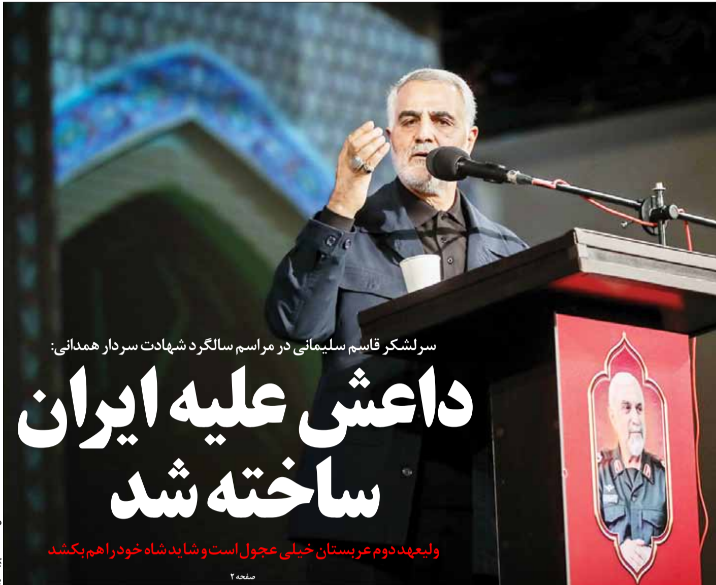
سرلشکر قاسم سلیمانی در مراسم سالگرد شهادت سردار همدانی: