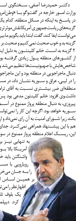
عکس نوشت دسته بازنده‌ها مشخص شد