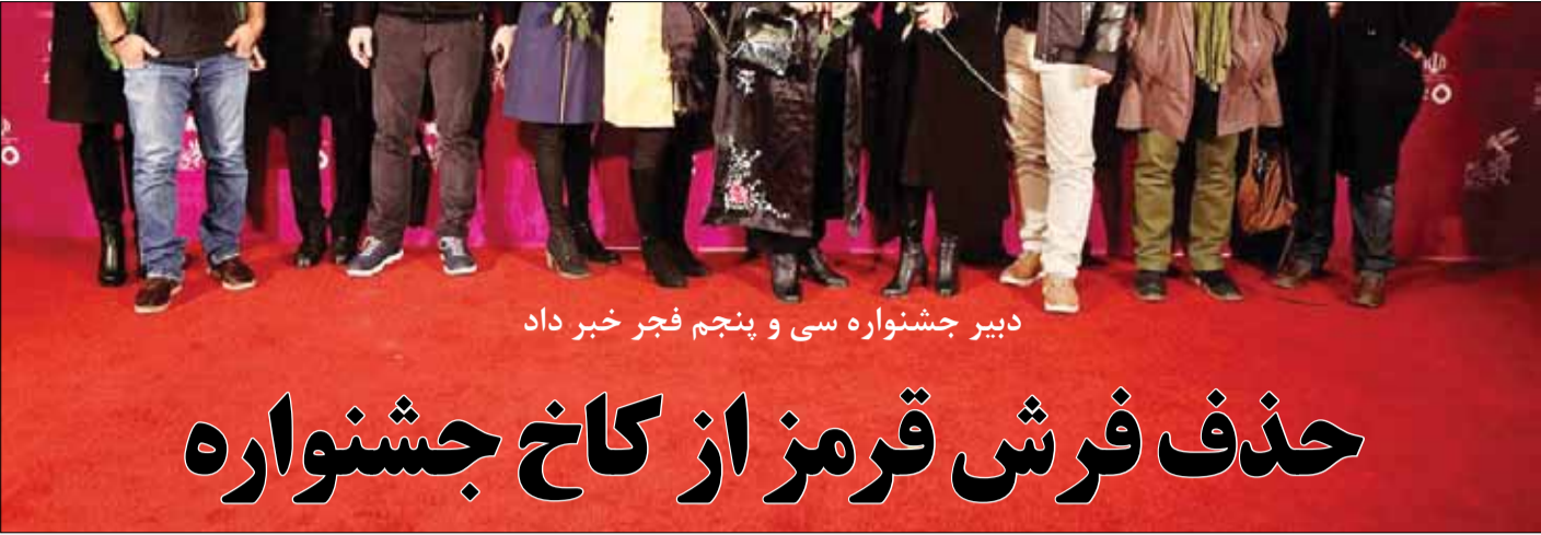
دبیر جشنواره سی و پنجم فجر خیر داد

ایمن اختتامیه هفتمین جشنواره مردمی فیلم عمار شب گذشته (۱۸ دی ماه) در حالی در فرهنگسرای بهمن برگزار شد که از گوشه و کنار ایران خیل عظیمی از خانواده‌های شهدای جنگ تحمیلی تا شهدای مدافع حرم، مردم علاقه‌مند و مستندسازان و فیلمسازان جشنواره فیلم عمار حضور داشتند. به گزارش فارس، مادر شهیدان خالقی‌پور که برای پاسداشت ابوالقاسم طالبی روی سن آمده بود، دربارۀ هدیه‌ای که نصیب ابوالقاسم طالبی شد، گفت: این جفیه ۶۰ روز به گردن پسرم بوده و با خون آغشته بود که برای من آوردند. من آن را با اشک چشم خود شست‌وشو دادم و الان احساس می‌کنم بهترین کار این است که آن را در اختیار یکی از بزرگان این جشنواره قرار دهم. مادر شهیدان خالقی‌پور گفت جشنواره مردمی عمار و مستندسازان آن عمارگونه هستند و نیاز به مال دنیا ندارند فقط یک جفیه ناقابل است، شاید اگر از نظر ظاهری آن را در خیابان بیندازیم کسی آن را بردارد اما برای من که ۳ فرزند می‌فلسل و کفن در خاک رفته‌اند، بارزش است. طالبی هم در بخشی از سخنان خود گفت: در یک جای آقایی گفته بودند من فیلم «یتیم‌خانه ایران» را دیدم، نوش جان آقای طالبی. من باید بگویم که پول یتیم‌خانه به جیب من نمی‌رود اما این را می‌توانم بگویم که من صد کتاب برای یتیم‌خانه خواندم این برای فرزندان کتب درسی می‌شود که با دیدن این فیلم تاریخ را آموزش می‌بینند. یکی از حاشیه‌های جالب این مراسم پذیرایی از مردم با کلوچه‌ها و نان‌هایی بود که مردم از شهرستان‌های مختلف تهیه کرده بودند، برخی از این نان‌ها از سفادشت از سوی زنان زحمتکش تهیه شده بود.