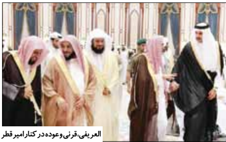
عرفی، قری، و عوده در کنار امیر قطر