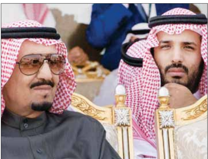
تشکیل کمیته مبارزه با فساد را تحت امر محمد بن سلمان صادر کرد.

بنابر گزارش خبرگزاری دولتی عربستان سعودی، این کمیته می‌تواند تحقیقاتی را به جریان بیندازد، قرار بازداشت صادر کند و نیز محدودیت‌های مسافرتی به وجود بیاورد یا دارایی‌های افراد را مسدود کند. اعضای این کمیته را هیات نظارت و تحقیق، رئیس هیات ملی مبارزه با فساد، رئیس دیوان نظارت عمومی، دادستان کل و رئیس سازمان امنیت عربستان تشکیل می‌دهند.