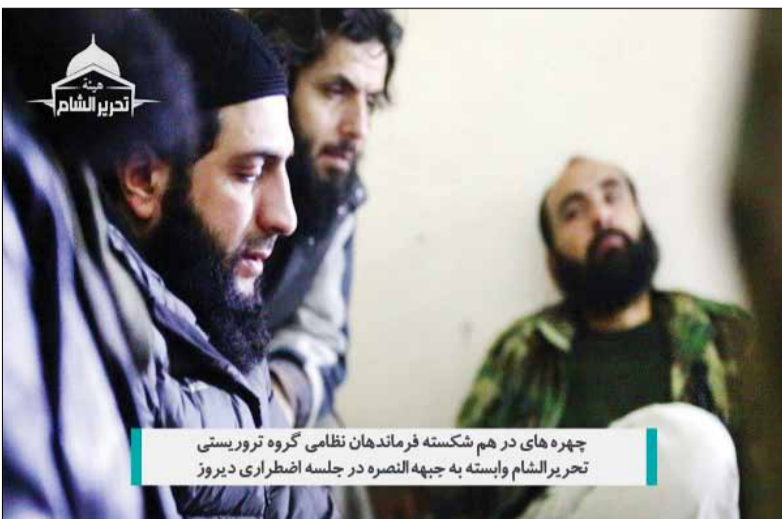
چهره‌های در هم شکسته فرماندهان نظامی گروه تروریستی تحریر الشام وابسته به جبهه النصره در جلسه اضطراری دیروز