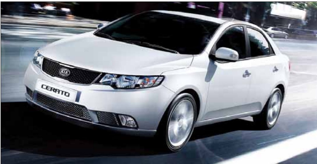
قیمت جدید خودروهای سایپا (تومان)