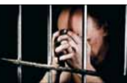
معاون وزیر دادگستری اعلام کرد

گذشته حدود ۱۱ هزار زندانی جرائم غیرعمد که حجم بدهی آنان حدود ۱۰ هزار میلیارد ریال بود، توسط ستاد دیه و حمایت‌های مردم آزاد شدند. ۴۰ درصد از این حجم بدهی با تلاش مددکاران ستاد دیه به گذشت شاکیان پرونده‌ها منتهی شد. معاون وزارت دادگستری به گزارش ایرنا، میرهادی قریسیدرومیانی در حاشیه اختتامیه پویش کمک به آزادسازی زندانیان جرائم غیرعمد، افزود: بر اساس آخرین آمار اعلامی سازمان زندان‌ها، حدود ۱۸ هزار زندانی بدهکار غیرعمد نظیر بدهی چک و مهریه در زندان‌های کشور بسر می‌برند وی گفت: بیشترین آمار زندانیان جرائم غیرعمد را بدهکاران مهریه و چک تشکیل می‌دهند که بدون پشتوانه مالی اقدام به صدور چک کرده‌اند. معاون حقوقی و امور مجلس وزارت دادگستری ادامه داد: سال