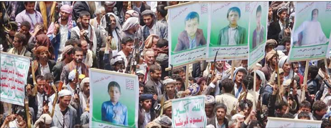
مراسم تشییع پیکر کودکان شهید در صعده با حضور گسترده مردم برگزار شد

همزمان با این عملیات، ارتش سوریه حضور نیروهای خود را در استان ادلب نیز افزایش داده است. استان و شهر ادلب در شمال غرب سوریه و هم‌مرز با ترکیه بعد از خروج ساکنان شهرک‌های شیعه‌نشین فوعه و کفریا، اکنون در اشغال تروریست‌هاست. منابع رسمی در سوریه، روز گذشته گزارش دادند