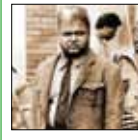
«مادر مُرد» از بس که جان ندارد» این دیالوگی است که شخصیت «غلامرضا» با بازی اکبر عبدی در یکی از اثرگذارترین سکانس‌های فیلم سینمایی «مادر» ساخته مرحوم علی حاتمی به زین اورد؛ دیالوگی که بعدها تبدیل به جمله‌ای طلایی در حافظه بسیاری از مخاطبان شد. وی در آن سال با بازی در این فیلم سیمرغ بلورین بهترین بازیگر نقش دوم مرد را از آن خود کرد. کاراکتر غلامرضا که فرزند معلول یک خانواده پرجمعیت بود، در میان نقش آفرینی ستارگانی چون محمدعلی سلگوروز و جمشید هاشم‌پور بخوبی به چشم مخاطبان آمد.