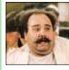
«آقای قندی» مستاجر مفلوک و درمانده آپارتمان‌پر از مشکل «اجارنشین‌ها»، یکی از ماندگارترین نقش‌های اکبر

عبدی در سینماست؛ نقشی که هنوز هم بسیاری از مخاطبان او را با سکاسن جالب منفرج شدن تلقن در دستنشان به‌خاطر می‌آورند؛ صحنه‌ای که به گفته ایرج راد یکی از بازیگران این فیلم، بدون بدلکار و توسط خود اکبری عبدی بازی شد. عبدی با هنرنمایی خود در «اجارنشین‌ها» داریوش مهرجویی، کاراکتر بدیعی خلق کرد که تبدیل به یکی از جنایات مثبت این اثر شده‌اند؛ اثری که هنوز در زمره شاخص‌ترین آثار سینمای پس از انقلاب جای دارد.