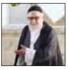
«حاج یوسف» فیلم‌های رسوایی هم از جمله نقش‌های ماندگار کارنامه کاری اکبر عبدی و البته از معبود روحانیون ماندگار سینمای ایران است. عابدی زاهد و اخلاقی‌مدار که مورد اعتماد مردم است ولی وقوع اتفاقاتی، گروهی از مردم را نسبت به او بدبین می‌کند. حضور اکبر عبدی در قامت روحانی و نقش اول هر ۲ قسمت این فیلم را می‌توان بزرگ‌ترین نقطه مثبت این فیلم دانست؛ فیلم‌هایی که اگرچه نتوانستند موفقیت «خراجی‌ها» و «معرای‌ها» را تکرار کنند ولی با این همه استقبال از آنها در گیشه سینماها نسبتاً قابل قبول بود.