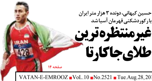
حسین کیهانی، دوندۀ ۳ هزار متر ایران با رکورد شکنی قهرمان آسیا شد غیرمنتظره‌ترین طلای جاکارتا