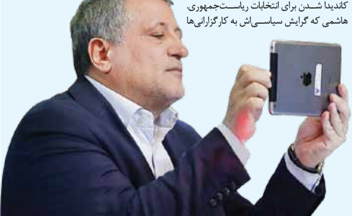
مدیرعامل سازمان تدارکات پزشکی هلال احمر:

به باور برخی کارشناسان حوزه شهری، بررسی واکنش‌ها و اظهارات رئیس شورا در تقابل موضوع انتخاب وی به عنوان شهردار در یک سال گذشته نشان می‌دهد به احتمال زیاد هاشمی نه تنها نیم‌نگاهی به شهردار شدن دارد، بلکه علاقه‌ای هم به حفظ جایگاه ریاست شورا ندارد؛ تصمیمی که البته اگر بخواهد گرفته شود با سد محکم اصلاح‌طلبان تهران فعالیت داشت مدیریت شورای شهر را بر عهده گرفت. آغاز به کار وی در شورا زمزمه‌هایی را برای آینده فرزند ارشد خانواده هاشمی ایجاد کرده؛ از قرار گرفتن در سمت شهردار تهران تا کاندیدا شدن برای انتخابات ریاست‌جمهوری. هاشمی که گرایش سیاسی‌اش به کارگزارانی‌ها