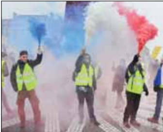
اعتراضات روز شنبه در پاریس

سال ۲۰۱۴ میلادی در زمان برگزاری انتخابات پارلمانی اروپا، افرادی مانند آنکلا مرکل صدراعظم آلمان، فرانسوا اولاند رئیس‌جمهور سابق فرانسه و دیوید کامرون نخست‌وزیر سابق انگلیس تمایلی نسبت به درک پیام انتخابات از خود نشان ندادند! مشارکت اندک و ۴۳ درصدی شهروندان اروپایی در انتخابات سال ۲۰۱۴ و راهیابی بیش از یکصد نماینده ملی‌گرا و ضد اتحادیه اروپایی، مقدمه ورود اروپایی واحد از فاز «اتحاد» به «بی‌نظمی» بود. این بی‌نظمی در سال‌های آتی خود را در اشکال و قالب‌های متنوعی بروز داد: از بحران مهاجرت تا بحران امنیت در سراسر اروپا! ساختار پیوسته اروپای واحد، این زمینه را فراهم کرد تا بحران‌های اجتماعی، امنیتی، اقتصادی و سیاسی با یکدیگر ترکیب شده و به «بربحران» خطرناکی برای موجودیت اتحادیه اروپایی تبدیل شوند. مکرون سال ۲۰۱۷ با توهم «رهبری اروپای واحد» و «مرمت ساختار تضعیف شده اتحادیه اروپایی» بر سر کار آمد. در این مسیر سیاستمدارانی مانند آنکلا مرکل نیز با رئیس‌جمهور جوان فرانسه همراه شدند. آنها معتقد بودند مکرون نه‌تنها به عنوان رئیس‌جمهور فرانسه، بلکه به عنوان وزنه‌ای که نماد اصلاح (Reform) در عین پایبندی به فئداسیون