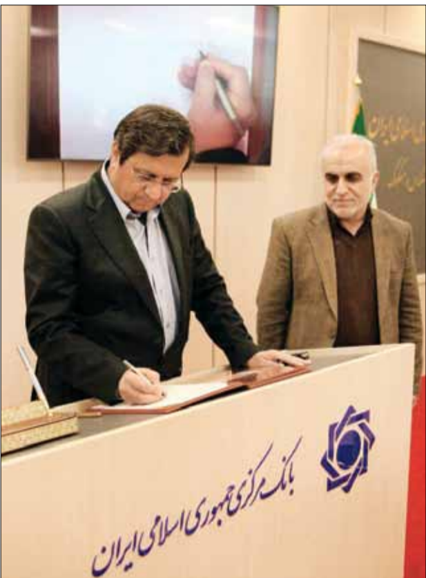
گزارش «وطن امروز» از طرح رفرم پولی و چالش‌های پیش روی دولت