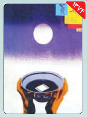
طراح: رضا عابدینی طراحی پوستر چهاردهمین دوره جشنواره فیلم فجر نیز به رضا عابدینی سپرده شد. او برای نخستین‌بار در طراحی پوسترهای این رویداد هنری سراغ خلق پوستر مفهومی رفت.