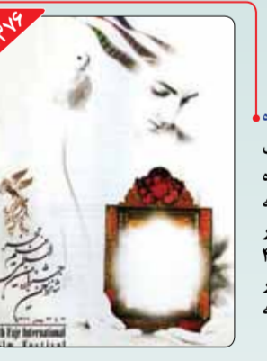
طراح: سیامک فیلی‌زاده آغاز سیزده ۴ ساله سیامک فیلی‌زاده بر طراحی پوستر جشنواره فیلم فجر از این دوره آغاز شد. او که از هنرمندان سرشناس ایرانی در حوزه گرافیک است، با طراحی ۴ دوره پوستر جشنواره فیلم فجر به شکل متوالی، رکورد منحصربه‌فردی را به نام خود ثبت کرد.