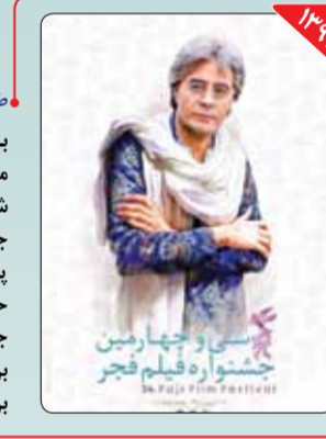
طراح: مجید بزرگو برای نخستین‌بار در این دوره از تصویر مرحوم خسرو شکیبایی، یکی از هنرمندان شاخص سینمای ایران برای طراحی پوستر جشنواره استفاده شد. البته طراحی پوستر این دوره حاشیه‌هایی هم داشت. حاشیه‌هایی که مربوط به طرح اصلی پوستر جشنواره بود. این پوستر با مدیریت مجید بزرگو و با نقاشی‌ای از بزگمهر حسین‌پور بر اساس عکسی از عزیز ساعتی تولید شد.