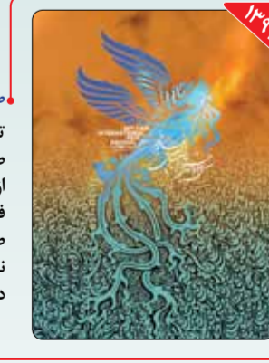
طراح: مهدی سعیدی تایپوگرافی ایده‌ای بود که مهدی سعیدی در طراحی پوستر جشنواره سی‌دوم فیلم فجر از آن استفاده کرد. سعیدی که از هنرمندان فعال در عرصه طراحی پوستر است، در طراحی این پوستر آلمان سیمرغ را به عنوان نماد جشنواره فیلم فجر، محور کار خود قرار داده است.