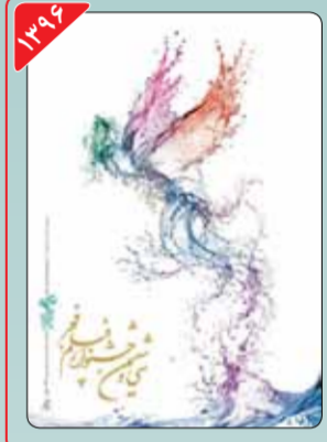
طراح: حمیدرضا بیدقی حمیدرضا بیدقی در دوره سی‌وششم جشنواره فیلم فجر، یک بار دیگر عهده‌دار طراحی پوستر این رویداد شد. او با هم از آلمان سیمرغ به عنوان محور انتشار این پوستر بحث‌هایی در ارتباط با استفاده از یکی از آیچک‌های آماده پیاذسازی شده نرم‌افزارهای طراحی در تولید این پوستر در رسانه‌ها مطرح شد.