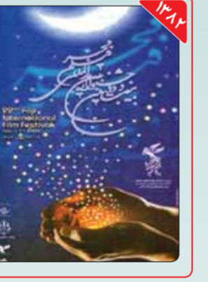
طراح: وحید تقی‌پور وحید تقی‌پور هنرمندی بود که در بیست‌دومین جشنواره فیلم فجر عهده‌دار طراحی پوستر جشنواره بود. او که به واسطه حضور فیلم‌هایی همچون «مارمولک»، «دول» و «سربازان جمعه» تبدیل به یکی از دوره‌های جنجالی جشنواره فیلم فجر شد.