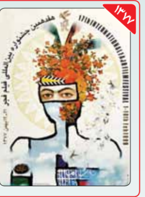
طراح: سیامک فیلی‌زاده فیلی‌زاده برای دومین بار در سال ۱۳۷۷ عهده‌دار مسئولیت طراحی پوستر جشنواره فجر شد. هر چند او در طراحی پوستر این دوره از آلمان سیمرغ به شکلی حداقلی استفاده کرد اما با توسل به روش ویژه خود که مبتنی بر ترکیب سنت و مدرنیته است، پوستر متفاوتی برای جشنواره فجر طراحی کرد.