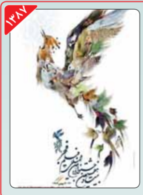
طراح: حمیدرضا بیدقی حمیدرضا بیدقی که پوستر جشنواره فجر امسال را هم طراحی کرده، برای نخستین‌بار در دوره بیست‌وهفتم این رویداد عهده‌دار طراحی پوستر جشنواره شد. او در طراحی پوستر این دوره آلمان سیمرغ را محور اصلی کار خود قرار داد.