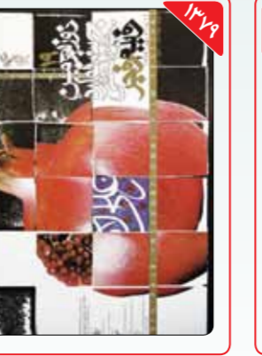
طراح: سیامک فیلی‌زاده دوره نوزدهم آخرین باری بود که سیامک فیلی‌زاده پوستر جشنواره فیلم فجر را طراحی کرد. او البته سال‌ها بعد و در سی‌وششمین جشنواره بین‌المللی تئاتر فجر نیز یک بار دیگر مسئولیت طراحی پوستر یکی از جشنواره‌های فجر را برعهده گرفت.