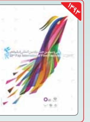
طراح: طاهما داگر طاهما ذاکر جوان‌ترین هنرمندی بود که طراحی پوستر جشنواره فیلم را برعهده گرفت. این هنرمند گرافیکست در دوره سی‌وششم جشنواره فیلم فجر به عنوان یکی از داوران بخش مسابقه تبلیغات جشنواره حضور داشت. او همچنین در سال ۱۳۹۴ برنده نشان طلای کتاب سال مجله معتبر «گرافیس» شد.