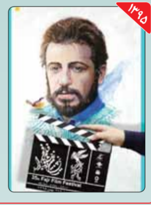
طراح: مجید بزرگو پوستر این دوره نیز با رویکرد دوره قبل و این بار با تصویری از مرحوم علی حاتمی، کارگردان سرشناس سینمای ایران طراحی شد. مدیر هنری پوستر «مجید بزرگو» بود و «حسین زارعی» طرح گرافیکت آن بود. نقاشی پوستر هم کار «علی بیگی پرست» بر اساس عکسی از «عزیز ساعتی» بود.