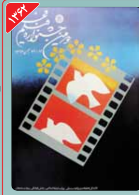
طراح: ابراهیم حقیقی ابراهیم حقیقی طراحی پوستر دومین جشنواره فیلم فجر را برعهده داشت. او با بار طراحی پوستر، رکورد دار طراحی پوستر جشنواره فیلم فجر است. پوستر این دوره نیز در حال و هوای انقلابی آن سال‌ها طراحی شده بود.