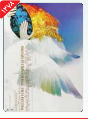
طراح: سیامک فیلی‌زاده دوره هجدهم جشنواره فیلم فجر سومین دوره متوالی بود که فیلی‌زاده پوستر جشنواره فیلم فجر را طراحی کرد. علاوه بر مفهومی بودن پوستر این دوره، آفتی بودن آن نیز از ویژگی‌های جالب توجه و منحصربه‌فرد پوستر هجدهمین دوره جشنواره فیلم فجر بود.