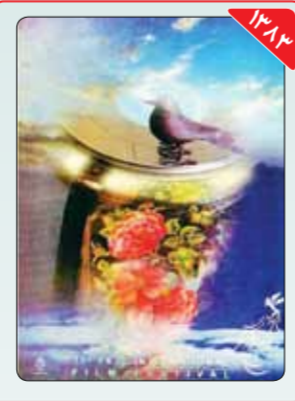
طراح: محسن سیدپوسنی سال ۸۳، سال فیلم‌های معناگرا بود. دوره‌ای که در آن فیلم‌هایی چون «بشارت منجی»، «بشت برده مه»، «جایی برای زندگی» و «خیلی دور، خیلی نزدیک» به نمایش درآمدند. محسن سیدپوسنی (طراح پوستر این دوره) با الهام از این فضا، پوستر معناگرا را طراحی کرد.