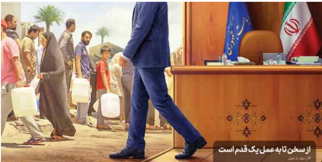
از سخن تا به عمل یک قدم است

با همه آنچه گفته شد، قانون نانوشته برخی دوره‌های فیلم فجر در دخالت دادن مسائل فرامتنی و قرار گرفتن تحت تاثیر فضا سازی‌ها و بعضاً ارجحیت دادن مسائل باندی و جناحی، در این دوره نیز انتخاب را برای هیات داوران سخت کرده است. در این دوره نیز این نگرانی وجود دارد که تحت تاثیر همین فضا سازی‌ها، بازی‌های خوب جواد عزتی، هادی حجازی‌فر و فرشته صدرعرفایی (که یک کلاس بازیگری متفاوت در «ششی» که ماه کامل شد» را از او دیدیم) و کارگردانی‌های کم‌نقص فیلم‌های خوب «ماجرای نیمروز ۲: زدخون» و «ششی» که ماه کامل شد» نادیده گرفته شوند که امیدواریم این اتفاق نیفتد.