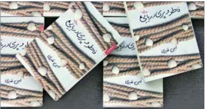
یادداشتی بر مجموعه داستان «فاطو و بری دریایی» که شهرستان ادب آن را منتشر کرده است

ای روه! اجتناب ز شیران کن بیری! فسون و خدعه چو پیران کن این نقشه نیست گربه دیروزی شیر است، دوری از دم شیران کن عهد فجر گذشت و شهبان رفتند اینگ حنرز خشم امیران کن بگذشت دور دزدی دریایی پس ترک آن سفینه ویران کن ای گوزپشت! خیره‌سری کمتر با راست‌قلمتان و دلبران کن عاقل‌تری از آن که به دام افتی ترک رکاب معرکه گیران کن با ملک فارس، پنجه نیفکن باز دوری ز خشم ملت ایران کن