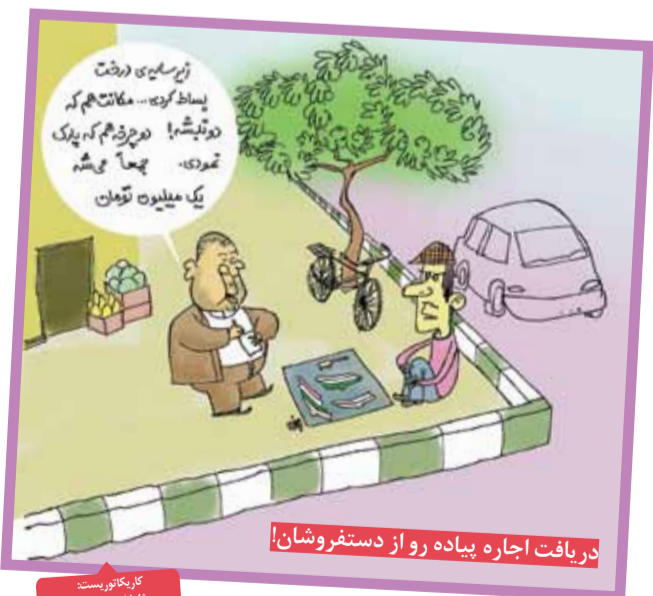
کریکاتور: ناصر جعفری

را به حدی می‌رساندیم که نگو، ولی این سریال گاندو نگذاشت و همه‌اش به خاطر پخش سریال گاندو است. شاید سوال کنید که چه ربطی دارد؟ جواب این است که اگر ربط نداشت، پس چرا؟! دولت که پول ندارد برای خودش سریال بسازد و خالی است جای آن در دولت. همین نفتکش ایرانی که توسط انگلیسی‌ها راهزنی شده است، طبق اعلام رسمی خود ملکه پوسیده‌شان، به دلیل پخش سریال گاندو بوده و آمریکا هم این سریال را دانلود کرده و به شورای حکام ارجاع داده است. دیگر خودتان می‌دانید، ما می‌رویم سد لیتان برای جت اسکی!