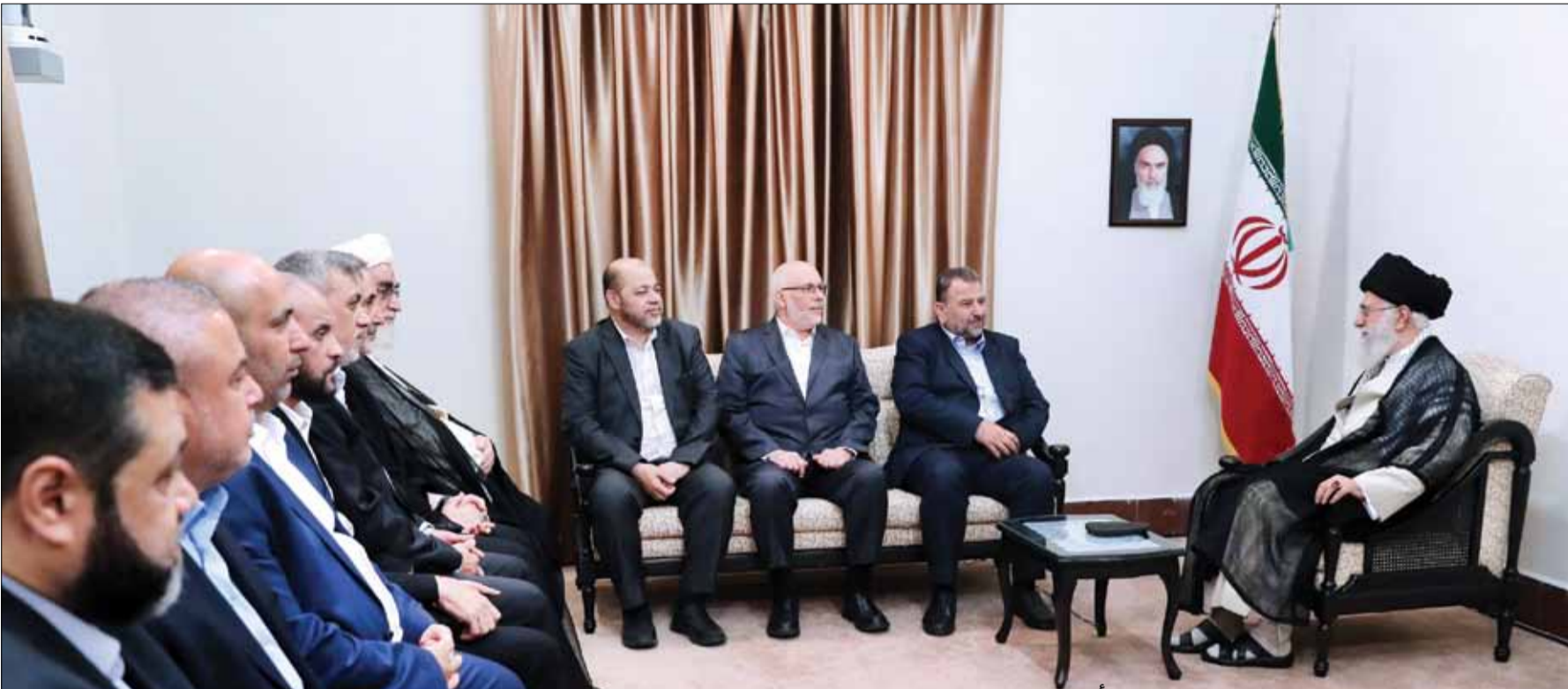
رہبر انقلاب در دیدار هیأتی عالی رتبه از جنبش حماس: