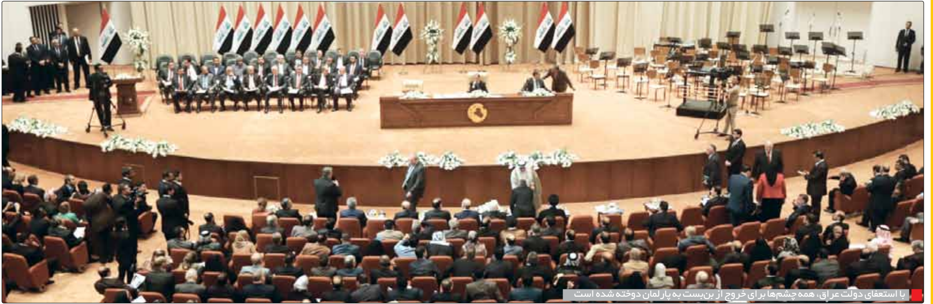
با استعفای دولت عراق، همه چشم‌ها برای خروج از بن‌بست به پارلمان دوخته شده است

در ادامه واکنش‌های تند مقام‌های ترکیه علیه مواضع اخیر امانوئل مکرون، رئیس‌جمهور فرانسه درباره اقدام نظامی آنکارا در شمال سوریه، رجب طیب اردوغان به همتای فرانسوی خود گفت: دچار مرگ مغزی شده‌ای.