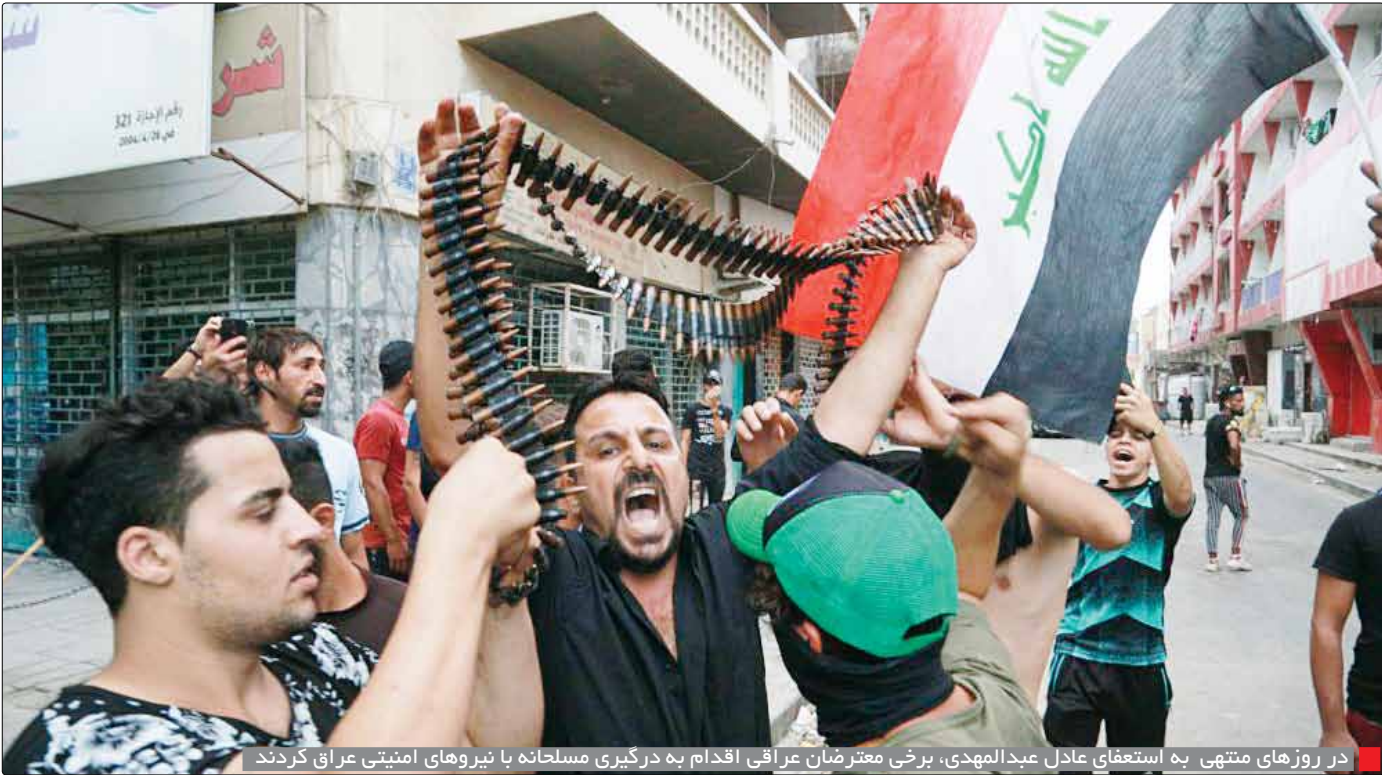
در روزهای منتهی به استعفای عادل عبدالمهدی، برخی معترضان عراقی اقدام به درگیری مسلحانه با نیروهای امنیتی عراق کردند

بویژه احزاب شیعی مثل الفتح به رهبری هادی العامری است