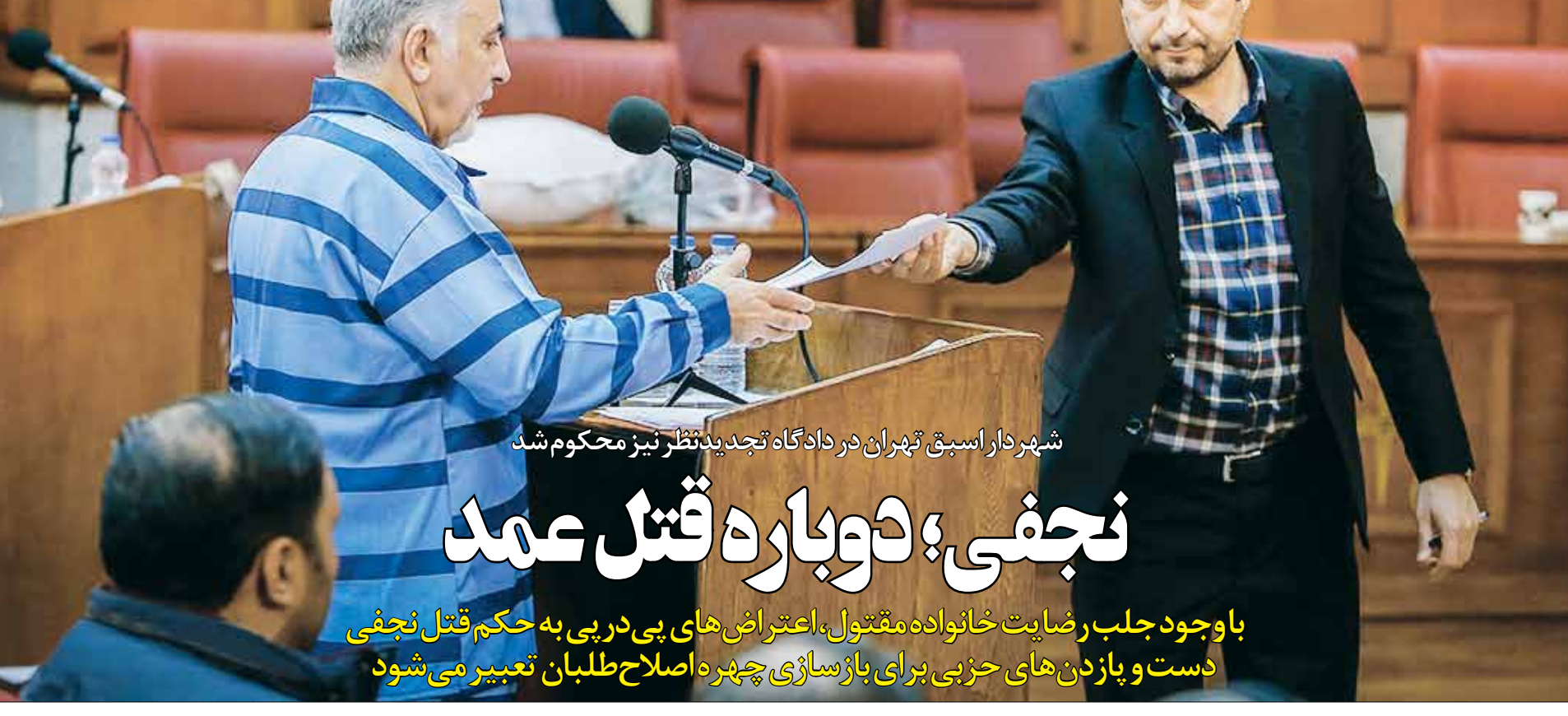
شهردار اسبق تهران در دادگاه تجدیدنظر نیز محکوم شد

مدیرکل امور فنی مستمری‌های سازمان تأمین اجتماعی گفت: ماهانه به‌صورت میانگین ۸۲۰۰ میلیارد درآمد و ۹۳۰۰ میلیارد تومان هزینه تأمین اجتماعی است. این آمار نشان می‌دهد برای بقا و استواری سازمان، باید به‌رغم توجه به درآمدهای سازمان، مرتب مصارف را رصد و چک کنیم. به گزارش ایسنا، محمدعلی جناتی گفت: حدود ۵۰ هزار میلیارد تومان از بانک‌ها