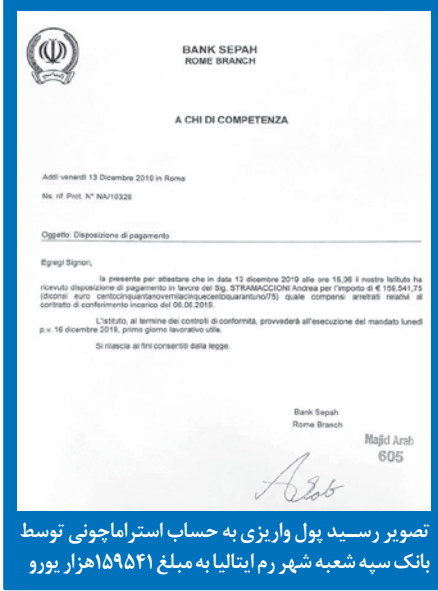
تصویر رسید پول واریزی به حساب استراماچونی توسط بانک سپه شعبه شهر رم ایتالیا به مبلغ ۱۵۹۵۶۱ هزار یورو