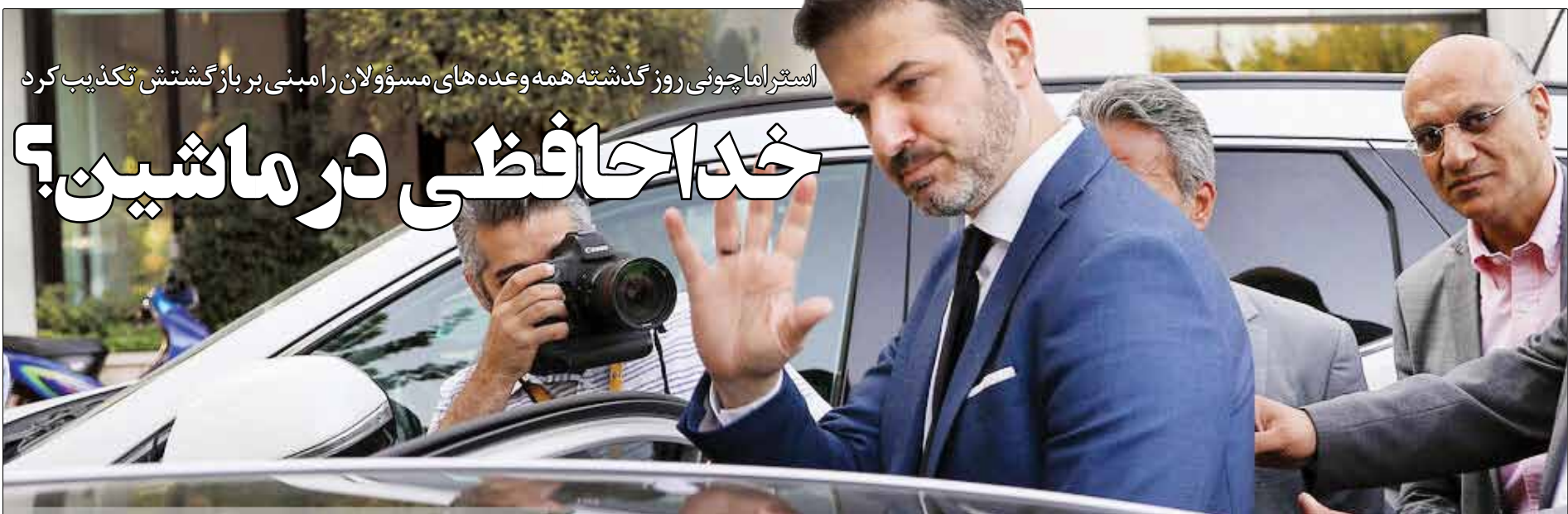
استقلالرماچونی روز گذشته همه وعده‌های مسؤولان رامبنی بر بازگشتش تکذیب کرد