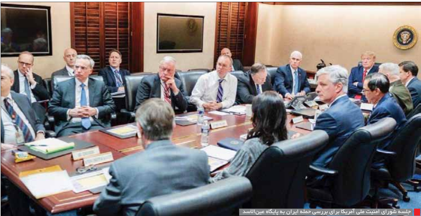
جلسه شورای امنیت ملی آمریکا برای بررسی حمله ایران به پایگاه عین‌الاسد

است از دیدگاه عموم مردم و رسانه‌ها دور کرده و آنها را پنهان می‌کردند. این اسناد که از طریق یک پروژه فدرال و به‌وسیله مصاحبه با دست‌اندرکاران و مسؤولان دولت‌های مختلف به دست آمده، نشان می‌دهد در بسیاری از موارد در شرایطی که ارتش آمریکا در حال تلفات دادن در جنگ با افغانستان بوده است، گزارش‌هایی منتشر می‌کرده که بیان می‌کرده ارتش این کشور در حال پیشرفت و کسب موفقیت در زمینه مقابله با طالبان و تروریسم در افغانستان است! (این مساله به قدری باعث عصبانیت نیروهای نظامی این کشور شده است که داگلاس لوت، ژنرال سه‌ستاره ارتش آمریکا که در طول جنگ با افغانستان در دولت بوش و اوباما در کاخ سفید خدمت می‌کرده، با عصبانیت بیان کرده است: ما در این جنگ ۲۴۰۰ سرباز را از دست دادیم و ۲۰ هزار و ۵۸۹ نظامی آمریکایی دیگر نیز مجروح شدند. اما چه به دست آوردیم؟ کسی نیست که به مردم آمریکا بگوید همه اینها به خاطر هیچ و بوج بوده است.