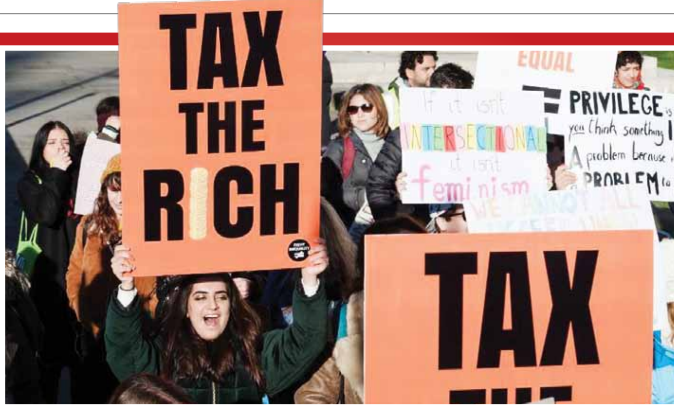
«وطن امروز» گزارش می‌دهد؛ چالش «مالیات ثروتمندان» از ایران تا آمریکا