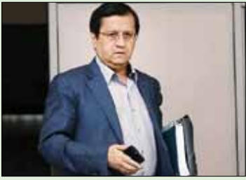
محمّد باقر قزوینی، رئیس‌کل بانک مرکزی