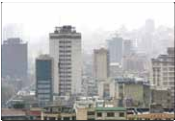
کاهش مسکن ملکی

یکی از شاخص‌های مهم در بخش مسکن که در اجرایی‌نشدن مالیات بر عایدی املاک دچار بحران شده است، شاخص خانوارهای دارای مسکن ملکی است. بر اساس سرشماری‌ها این شاخص که از سال ۱۳۳۵ تا ۱۳۶۵ روند رو به رشدی داشت، با حذف قوانین فصل املاک بین سال‌های